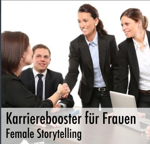
Karrierebooster für Frauen Female Storytelling

EINE AUSWAHL VON VORTRÄGEN UND WORKSHOPS - INDIVIDUELL ANPASSBAR - LIVE - HYBRID - ONLINE